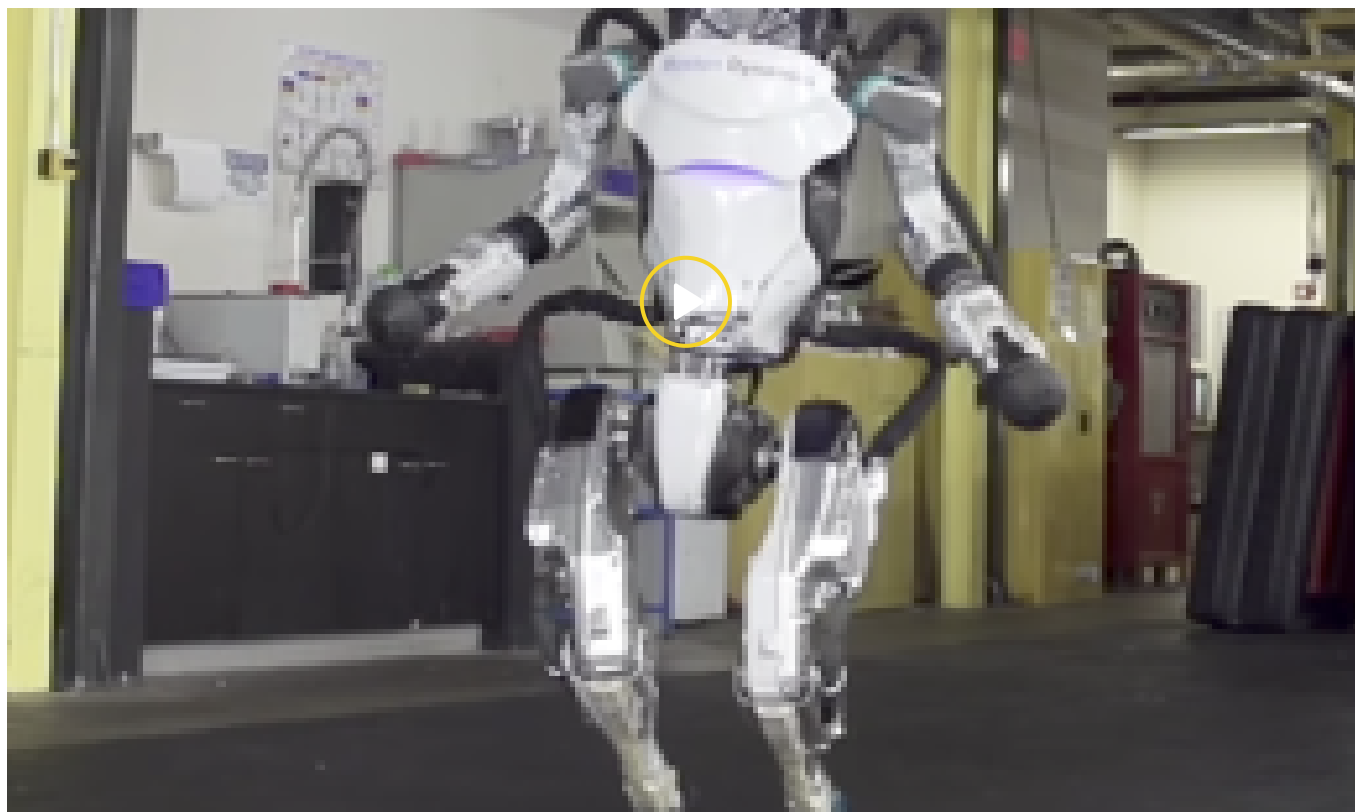
Gli esercizi ginnici (perfetti) del robot Atlas